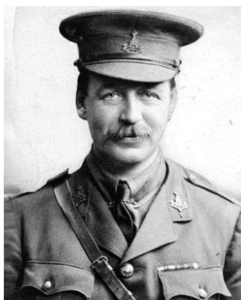
سر مارک سایکس

تسلط پیدا کرد فیلمی منتشر شد، که در آن بلدوزری، موانع مرزی میان عراق و سوریه را تخریب می‌کرد و عده‌ای هم اسلحه به دست خوشحالی می‌کردند، کمی هم بعد، ابوبکر البغدادی سرکرده‌ی داعش در مسجد نوری موصل، هنگام اعلام خلافت خود در نماز معروفش گفت: پیشروی ما تا هنگامی که آخرین میخ را بر تابوت عهد نامه سایکس پیکو بکوبیم، تداوم خواهد یافت. و امامشکلات ژئوپولیتیک ناشی از عهدنامه سایکس پیکو که به خاورمیانه وارد شد، امروز پس از گذشت یکصد و دو سال بیش از پیش خودنمایی می‌کند، و بزرگ‌ترین ارمغانش برای خاورمیانه به وجود آمدن کشورهای مصنوعی بود، دولت‌های بی‌ملت و ملت‌های بی‌دولت، که این خود سرآغاز جهنمی شدن خاورمیانه شد، جهنمی که روز به روز بر آتش آن افزوده می‌شود.