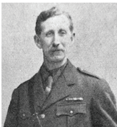
فرانسوا ژرژ پیکوی

تسلط پیدا کرد فیلمی منتشر شد، که در آن بلدوزری، موانع مرزی میان عراق و سوریه را تخریب می‌کرد و عده‌ای هم اسلحه به دست خوشحالی می‌کردند، کمی هم بعد، ابوبکر البغدادی سرکرده‌ی داعش در مسجد نوری موصل، هنگام اعلام خلافت خود در نماز معروفش گفت: پیشروی ما تا هنگامی که آخرین میخ را بر تابوت عهد نامه سایکس پیکو بکوبیم، تداوم خواهد یافت. و امامشکلات ژئوپولیتیک ناشی از عهدنامه سایکس پیکو که به خاورمیانه وارد شد، امروز پس از گذشت یکصد و دو سال بیش از پیش خودنمایی می‌کند، و بزرگ‌ترین ارمغانش برای خاورمیانه به وجود آمدن کشورهای مصنوعی بود، دولت‌های بی‌ملت و ملت‌های بی‌دولت، که این خود سرآغاز جهنمی شدن خاورمیانه شد، جهنمی که روز به روز بر آتش آن افزوده می‌شود.