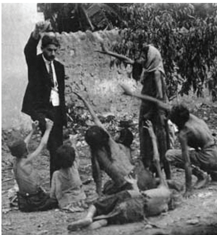
تحقیق ارامنه در حال مرگ با نشان دادن تکه نانی به دست مامور عثمانی (در جریان ژینوساید آنها توسط دولت عثمانی)

عراق و ایران، رخ داد و هولناکترین جنایت شیمیایی بشر در این دوره محسوب می شود. تراژدی که در آن دست کم پنج هزار غیر نظامی کرد در دم جان باختند و بیش از هفت هزار نفر دیگر به جراحت های مرتبط به مواد شیمیایی مبتلا شدند. این حادثه با بازتاب بسیار کم رسانه ها مواجه شد و دولت ها غربی هم نسبت به این رخداد بی تفاوت گذشتند و کمتر زحمتی را به خود دادند، که کوچکترین قطع نامه یا بیانیه ای را بر ضد دولت متخاصم صادر کنند. نمیدانم شاید آنها بشر محسوب نمی شدند یا این حقوق به آن ها تعلق نمی گرفت و یا منافعشان آن ها را وادار به سکوت می کرد.